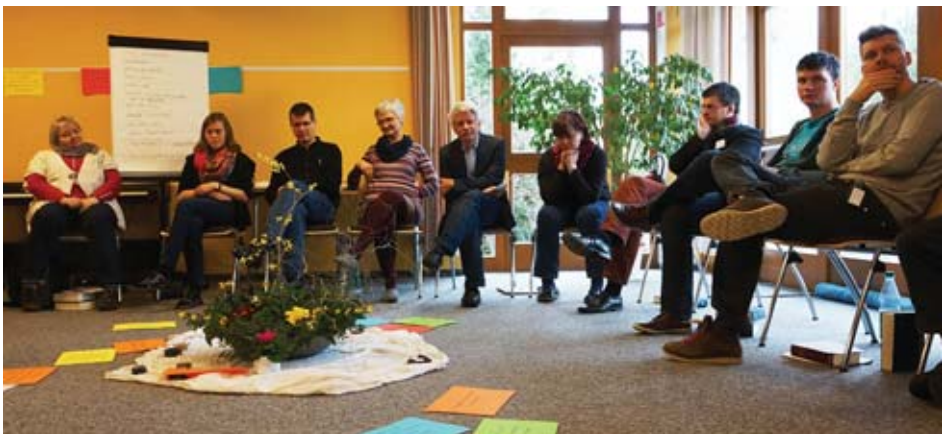
Klausurtagung des Kirchenvorstandes und der Mitarbeiter

Jedes Jahr holen die Kinder am Osterdienstag aus der Kirche das Osterlicht in den Kindergarten. Die Kerze begleitet uns ein Jahr lang und erinnert an die Auferstehung Jesus. In der Kar- und Osterwoche hören wir jeden Morgen Geschichten aus dem Leben Jesu. Im Flur entsteht dann ein Kreuz- und Osterweg. Die Bilder erzählen dann beispielsweise vom Einzug in Jerusalem, von den umgeworfenen Tischen der Händler im Tempel, vom gemeinsamen Abendmahl oder von den Frauen am Grab, wie die Jünger den Auferstandenen erkennen und vom Missionsauftrag.