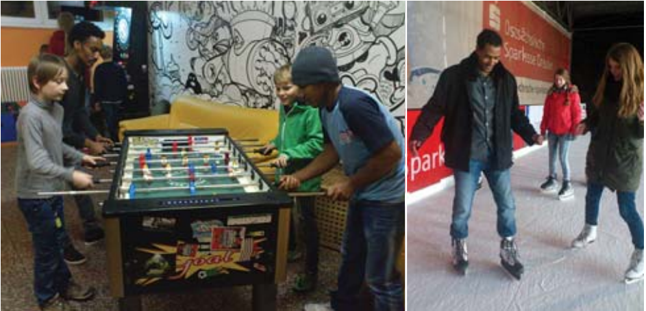
...Kickern mit der Jungschar ...Eislaufen mit der JG Bannewitz