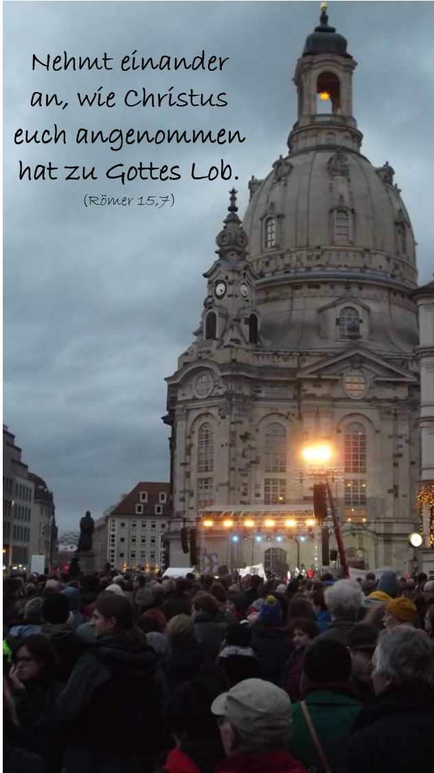
35.000 Menschen demonstrieren für Mitmenschlichkeit und Dialog am 10.01.2015