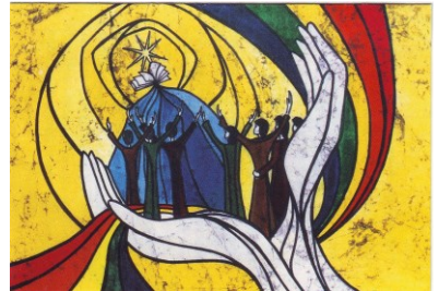
Die Freude am Herrn ist eure Stärke