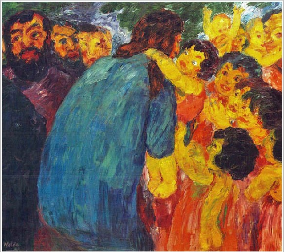
Emil Nolde, Christus und die Kinder