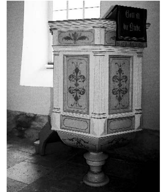
Kanzel in der Großdittmannsdorfer Kirche